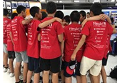
無事に帰国。参加メンバー全員が、口々に「楽しかったです。良い経験ができました！」と言ってくれてました。プロジェクトをサポートくださった皆さま、どうもありがとうございました！ Safely home! Thank you everyone who supported the project. The trip was a huge success!

主催：認定特定非営利活動法人ハンズオン東京 特別協賛：Major League Baseball 協力：One Desk Foundation 協賛：合同会社日本 MGM リゾーツ / 日本航空株式会社 / 東京美容外科 / 株式会社東横イン / 株式会社アイル / 合志ライオンズクラブ / 山鹿ライオンズクラブ