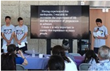
全米日系人博物館で、それぞれが体験した震災や自然災害から学んだことについてプレゼンテーション Making presentations about their hometowns and what the natural disasters have taught them at Japanese American National Museum.