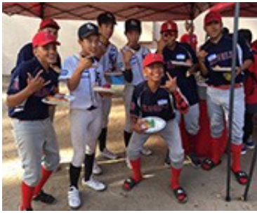
たくさんの笑顔。最高の思い出 So many smiles. Memories of a lifetime.