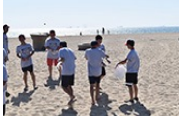
ボランティア活動のためビーチへ。地域社会に貢献する大切さと環境の保護について学ぶ機会になりました At the beach for volunteering. Learning about the importance of giving back to the local community and protecting the environment through beach cleaning.