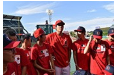
大谷翔平選手にお会いできました！ Time with a National Hero: Shohei Ohtani